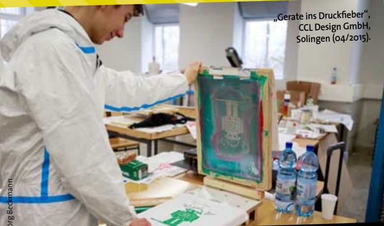
„Geräte ins Druckfeber“, CCL Design GmbH, Solingen (04/2015).