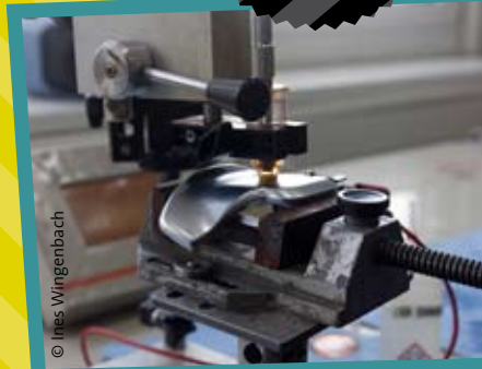
„Verchrome dein eigenes 3D-Modell“, BIA Kunststoff- und Galvanotechnik GmbH & Co. KG, Solingen (10/2014).