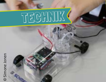
„Das Brennstoffzellenauto“, K.A. Schmersal GmbH & Co. KG, Wuppertal (10/2016).