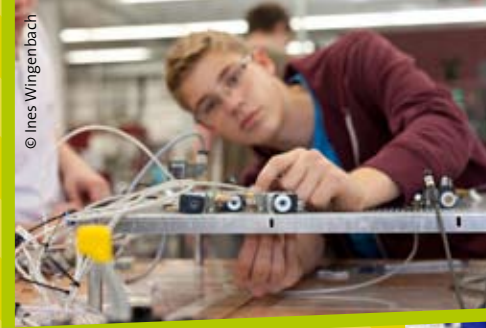
„Mechatronik zum Anfassen“, Brose Schließsysteme GmbH & Co. KG, Wuppertal (10/2014).