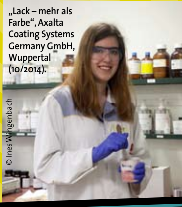
„Lack – mehr als Farbe“, Axalta Coating Systems Germany GmbH, Wuppertal (10/2014).