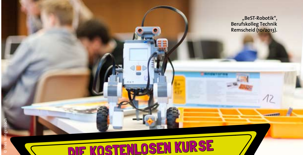
„BeST-Robotik“, Berufskolleg Technik Remscheid (10/2013).